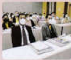
ผู้เข้าร่วมประชุมรับฟังการนำเสนอโครงการ