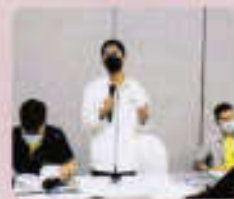
ผู้เข้าร่วมประชุมแสดงความคิดเห็น