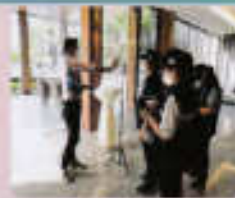
การพิจารณาผู้เข้าร่วมประชุม ตามมาตรการโควิด 19