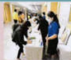
ผู้เข้าร่วมประชุม ลงทะเบียน