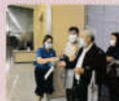
ผู้เข้าร่วมประชุมให้กำลังใจคณะกรรมการ