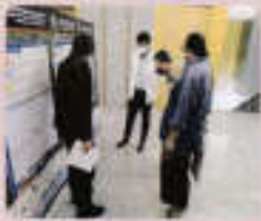
ผู้เข้าร่วมประชุมในขณะเปิดโครงการ