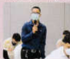
ผู้เข้าร่วมประชุมแสดงความคิดเห็น