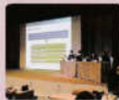
วิทยากรนำเสนอการประเมินผลกระทบ