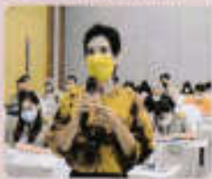
ผู้เข้าร่วมประชุมแสดงความคิดเห็น