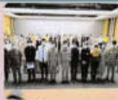
ผู้เข้าร่วมประชุม ถ่ายภาพที่ระลึกร่วมกัน