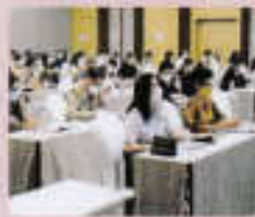
ผู้เข้าร่วมประชุมรับฟังการนำเสนอโครงการ