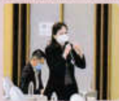
ผู้เข้าร่วมประชุมแสดงความคิดเห็น