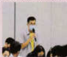
ผู้เข้าร่วมประชุมแสดงความคิดเห็น