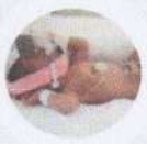
ปอดแลกเปลี่ยนออกซิเจนไม่ได้ ต้องช่วยหายใจ

ระยะการตั้งครรภ์ที่สั้นสุดก่อน 37 สัปดาห์ หรือที่เรียกว่า "คลอดก่อนกำหนด" ส่งผลให้เกิดอันตรายต่ออวัยวะสำคัญของร่างกายดังแสดงในภาพ บางรายอาจมีผลต่อการเจริญเติบโตและพัฒนาการที่ผิดปกติเมื่อโตขึ้น